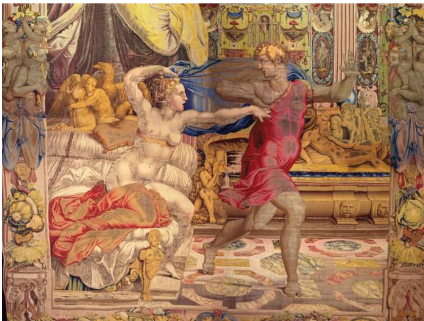
Arazzo fiorentino del '500 serie commissionata dal Granduca Cosimo Giuseppe e la moglie di Putifar

racconto dell'autore suo omonimo, esorta la signora a domare la propria passione, le dice che lui conosce il proprio dovere di obbedirle, ma che a quell'ordine non poteva sottostare. Lei lo invita a non resistere oltre, per il rispetto che doveva alle sue richieste, cui avrebbe dovuto congiungersi la tenerezza nel vederla supplice per amore di lui, e quindi a non mostrarsi ingrato. Lo rassicura sulla sua discrezione, gli fa intravedere oltre il piacere dei sensi l'utilità dei favori, e lo ammonisce sulla conseguenza di odio che sta provocando in lei, se crede che la castità valga più della condiscendenza alla sua padrona. Giuseppe continua a cercare della persuasione, invitandola a ricordare i momenti belli del matrimonio con Putifar e il conforto della fedeltà al marito, assicurandola che non c'era in lui superbia e che avrebbe anzi tanto più riconosciuto la sua autorità di padrona nel vederla controllarsi e tornare sulla buona via. Ma, così parlando, non faceva che esasperarla e accendere maggiormente il suo desiderio, finché lei lo afferra e, quando lui si sottrae, resta in possesso del mantello o vestito, beghed .