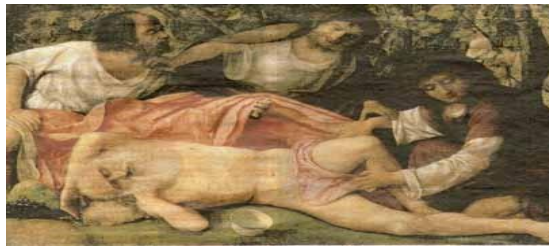
Ubriachezza di Noè di Giovanni Bellini, il Giambellino , 1429 o 1430 - 1510

Frattanto il vecchio Noè, per quanto giusto , da coltivatore di vigne, cede all'attrattiva del vino, si ubriaca e si denuda.