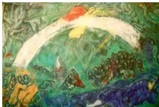
Chagall, Mosè e l'Arcobaleno

Noè ed i suoi affrontano, al sicuro nell'arca, non senza timore, l'esperienza, tutto intorno a loro, del diluvio universale, con l'intera sommersione di quella terra emersa, che in Bereshit era stata provvidenzialmente divisa dalle acque. Il diluvio comincia sette giorni dopo la loro sistemazione nell'arca, precisamente il giorno diciassettesimo del secondo mese del secentesimo anno di vita di Noah. Il diluvio dura quaranta giorni e la terra resta ricoperta dalle acque, che scemano a poco a poco, fino all'inizio dell'anno seicento uno della vita di Noè. Quindi la famiglia è rimasta nell'arca per più di dieci mesi, dopo aver mandato in esplorazione della terra asciutta il corvo e la colomba.