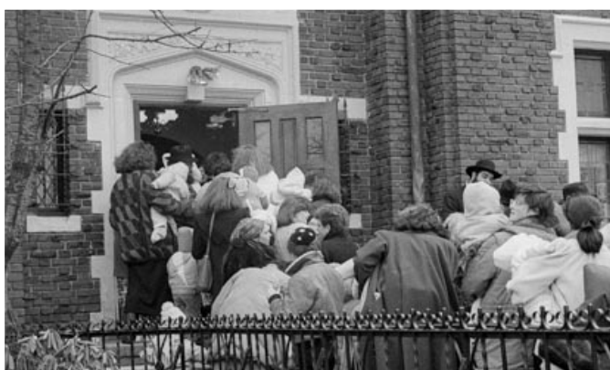
People waiting outside 770 for their turn to see the Rebbe.